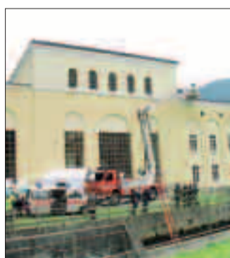
La manovra di protezione civile

Con gli operai delle squadre meccanica ed elettrica di «Primiero Energia» hanno operato i Vigili del fuoco volontari del Distretto di Primiero, la Croce rossa di Canal San Bovo, il personale del «118» Trentino Emergenza, il Soccorso alpino del Primiero e il Soccorso alpino della Guardia di finanza, i Nuvola del Primiero e del Vanoi, per un totale di circa 130 persone. Sono stati simulati sette scenari di intervento il più possibile vicino alla realtà: i soccorritori si sono quindi trovati a sorpresa a recuperare operai infortunati nel canale di scarico della centrale, a soccorrere personale infortunato in gallerie di ispezione lunghe oltre 100 metri, a recuperare persone infortunate sul carroponne e operai feriti, ustionati o schiacciati in officina. L'esercitazione è terminata con uno spett-