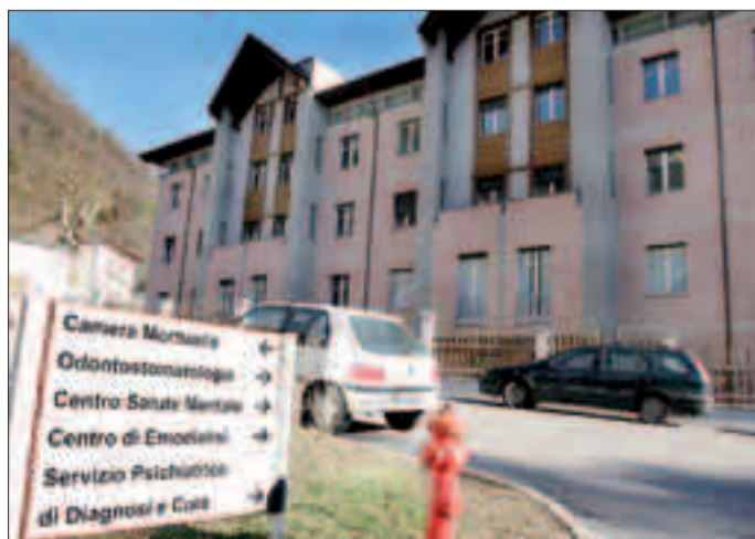
L'ospedale di Borgo